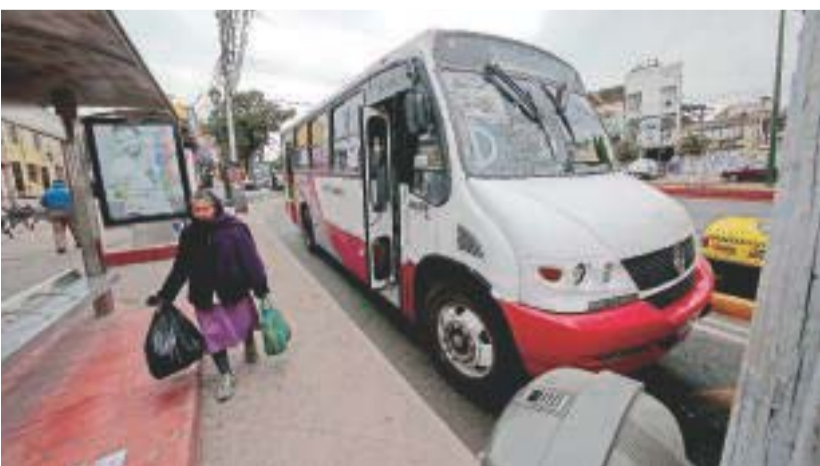
A partir del 15 de enero, los 12 concesionarios del transporte público conformarán una sola empresa que será registrada ante notario.