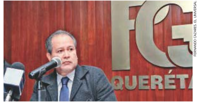
El procurador Alejandro Echeverría dijo que la banda operaba en Querétaro y Guanajuato; se reservó el nombre de los implicados.

Las investigaciones señalan la participación de otros cuatro presuntos responsables y su vinculación en la comisión de otros dos secuestros cometidos en el estado.