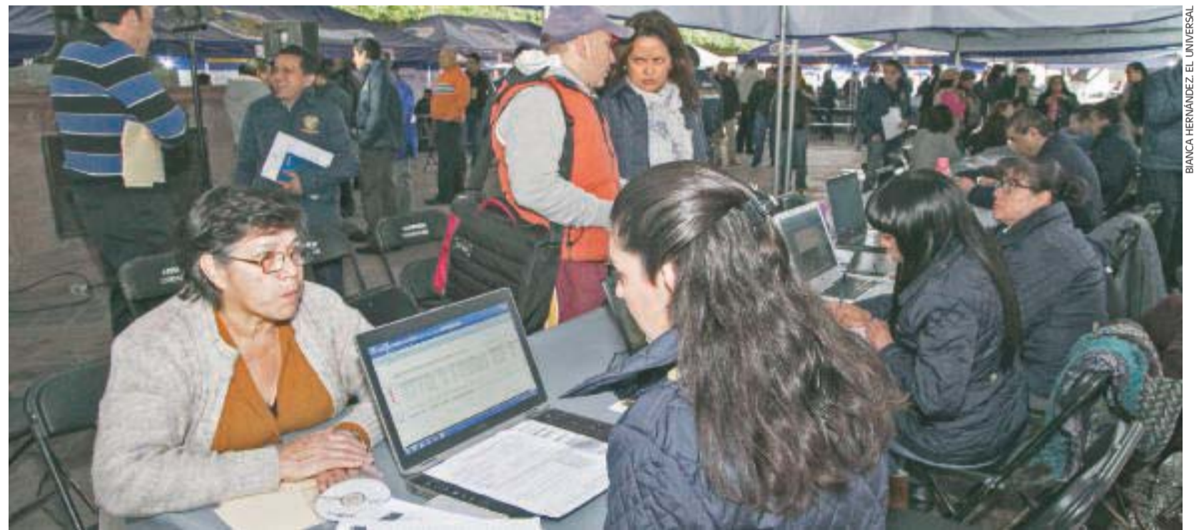
Con el objetivo de atender personalmente las peticiones, quejas, dudas y sugerencias de los ciudadanos capitalinos, el alcalde Marcos Aguilar Vega comenzó con los Miércoles Ciudadano, en Jardín Guerrero; señaló que será itinerante el programa. A6